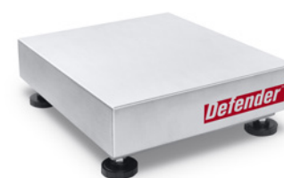
305 x 355mm (12 x 14 cale)

Platformy oferują zakres ważenia od 15 kg w wymiarach 305 x 355 mm do 600 kg w wymiarach 600 x 800 mm i uzyskały certyfikaty OIML (NTEP i Measurement Canada). Seria Defender 3000 jest przeznaczona do podstawowych zastosowań przemysłowych i codziennej pracy, po której jest zawsze gotowa do kolejnego zadania.