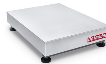
420 x 550mm (16.5 x 21.7 cale)