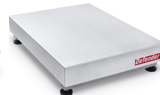
600 x 800mm (23.6 x 31.5 cale)