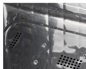
System cyrkulacji gorącego powietrza