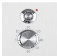
Regulacja czasu pracy